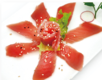
99. TONNO € 9,00