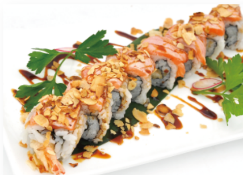
80A. FLAMME TIGER ● € 12,00 gamberi in tempura, salmone, mandorle