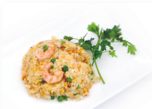
40. RISO SALTATO CON GAMBERI € 6,00