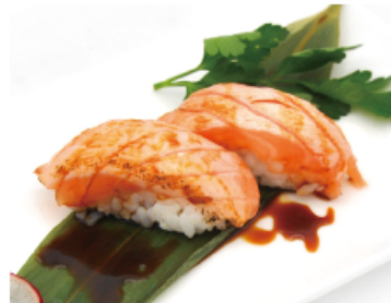
113B. SAKE CHIPS € 4,00