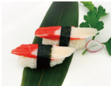
116. GRANCHIO € 2,50