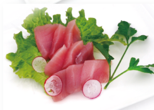
96. TONNO € 13,00 filetti di tonno