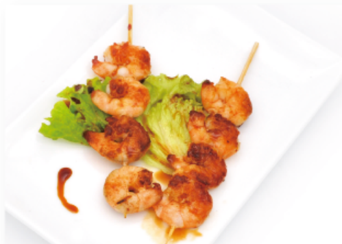
35. SPIEDINI DI GAMBERI € 7,00