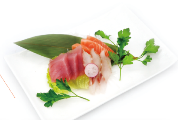
97. MIX € 11,00 filetti di pesce crudo misto