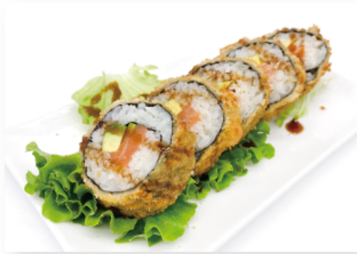
29. FUTO CRUNCHY € 8,00