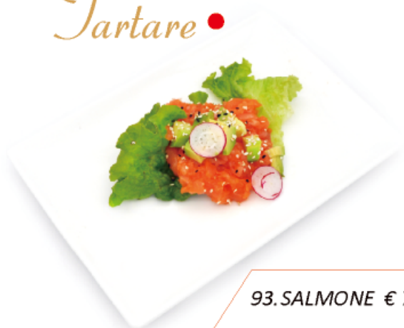
93. SALMONE € 7,00