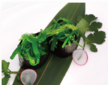
109. VEGGIE 🌱 € 3,50