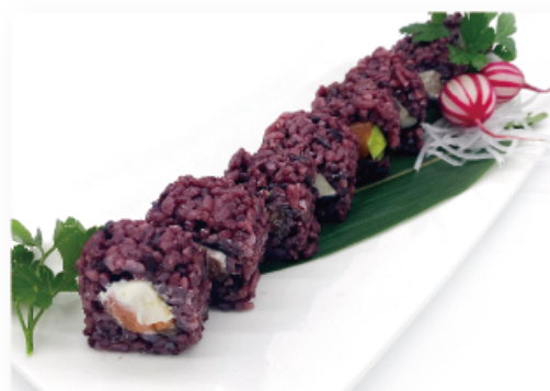
86. MELA MAKI € 8,00 riso venere, salmone, mela verde, philadelphia, tobiko