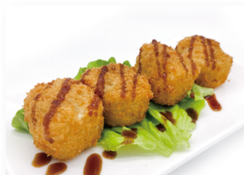
28. URA CRUNCHY € 8,00