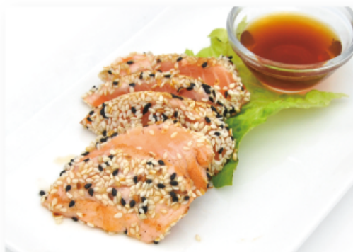
37. SALMONE TATAKI € 7,00