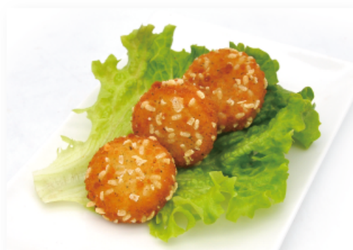
27. CROCCHETTE ● € 5,00 formaggio verdure