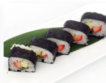
92A. FRUTTO € 7,00 frutta mix