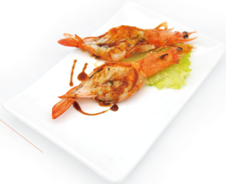
31. GAMBERI * € 9,00