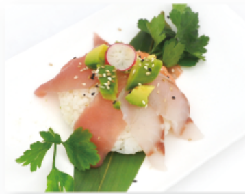
103. MIX CHIRASHI € 10,00