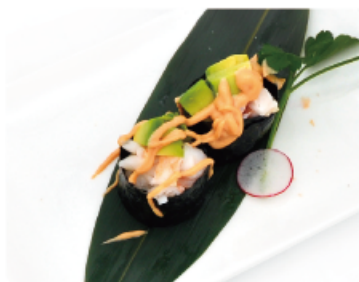
108. EBI* € 5,00 gambero, avocado