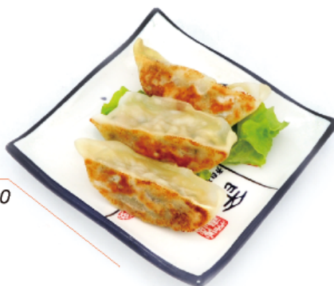
6. JIAOZI € 4,00 ravioli di pollo 3pz