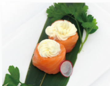
110. PHILADELPHIA € 4,00 salmone, philadelphia