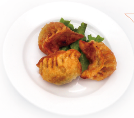
10. ZHAJIAO € 5,00 ravioli fritti 3pz