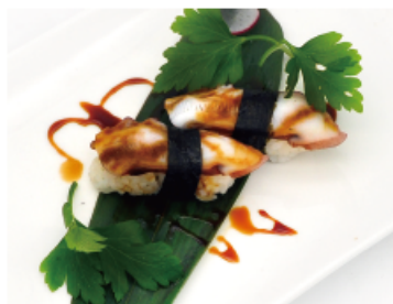
119. POLPO € 3,00