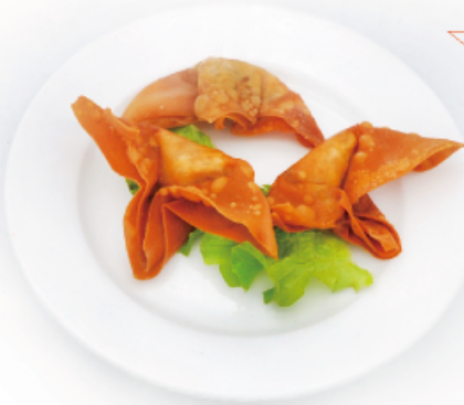
14. HUNTUN € 4,00 wanton fritto