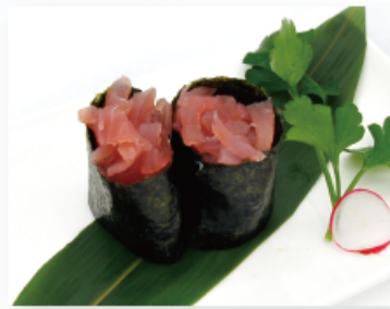
105. SPICY TUNA € 4,00