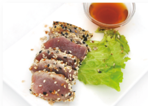
38. TONNO TATAKI € 10,00