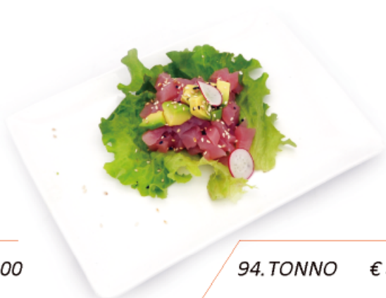
94. TONNO € 8,00