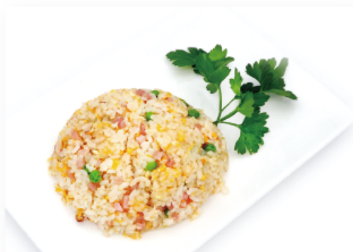
42. RISO CANTONESE € 4,50