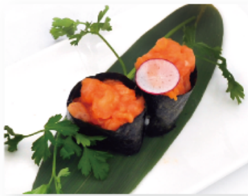
104. SPICY SALMON € 3,50