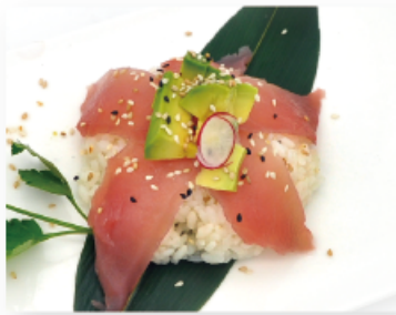
102. TEKKA DON ● € 11,00 tonno