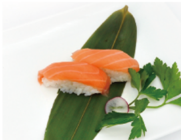
113. SALMONE € 2,50