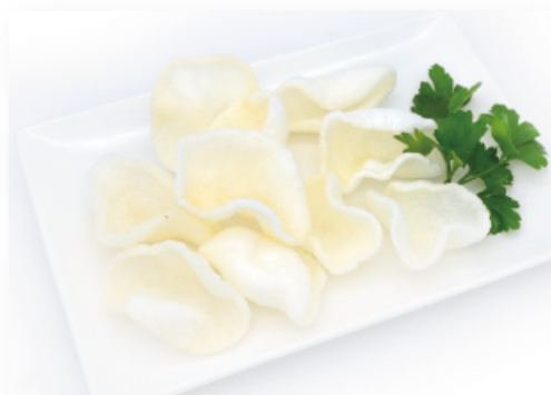
19. NUVOLE DI DRAGO € 3,00