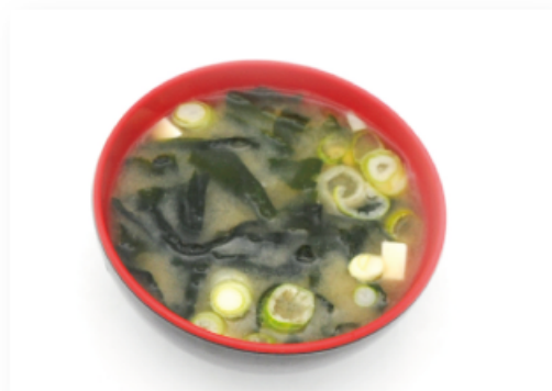
20. ZUPPA DI MISO € 2,00