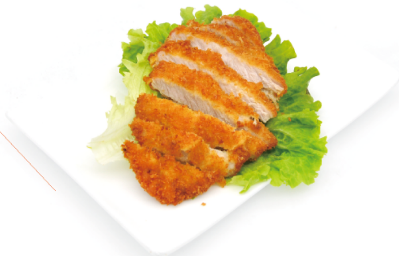
22. TONKATSU € 5,00 cotoletta di maiale