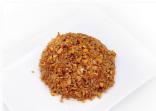
41. RISO SALTATO CON POLLO € 5,00