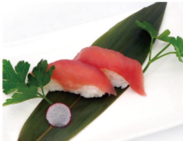
115. TONNO € 3,00