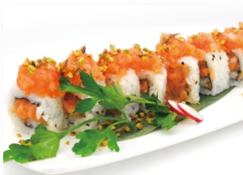
77A. SUPER SPICY SALMON ● € 10,00 salmone tritato in salsa piccante, maionese, pistacchio