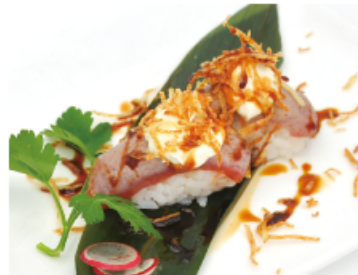
115A. TONNO FRESH € 4,00