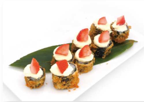
30. HOSSO CRUNCHY € 5,00