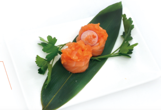
106. SALMON OUT € 4,00