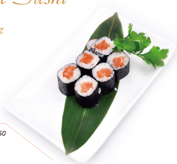
60. SAKE MAKI salmone