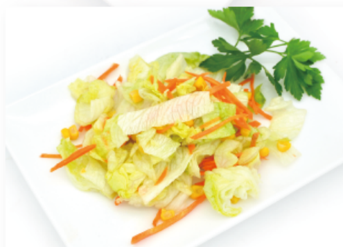
17. INSALATA MISTA € 4,00