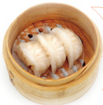
9. HARGOW € 5,00 ravioli di gamberi 3pz*