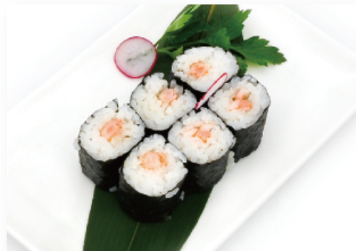
62. EBI MAKI * gambero