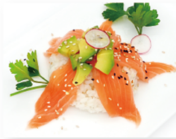
101. SAKE DON € 9,00 salmone