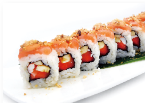
88. SUMMER MAKI € 10,00 banana, salmone, gambero, nocciole