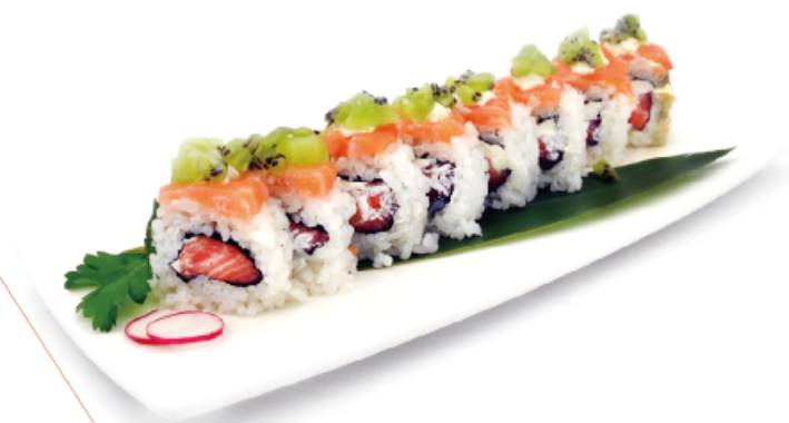
90. WINTER MAKI € 10,00 kiwi, salmone, philadelphia