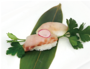
114. BRANZINO € 2,50