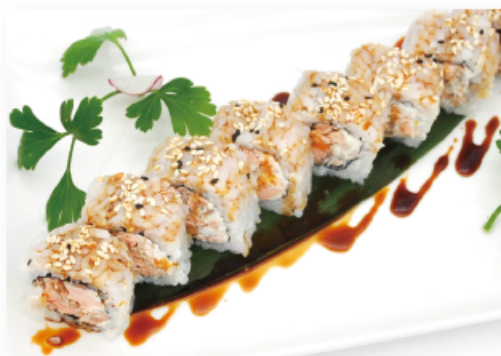
75. URAMAKI MIURA € 7,00 salmone cotto, philadelphia