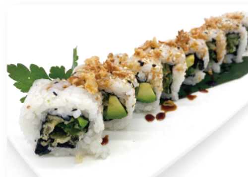
89. AUTUMN MAKI € 7,00 insalata frita, avocado, salsa rosa, cipolla frita