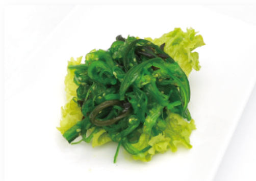
16. GOMAWAKAME * € 4,00 alghe marine