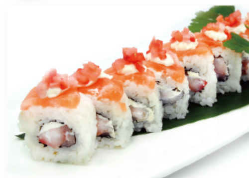
87. SPRING MAKI € 10,00 fragola, branzino, salmone, philadelphia