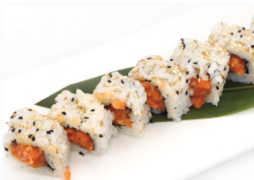
77. URAMAKI SPICY SALMON € 8,00 salmone tritato in salsa piccante