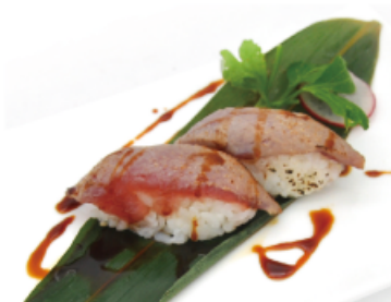
115B. TONNO CHIPS € 4,00