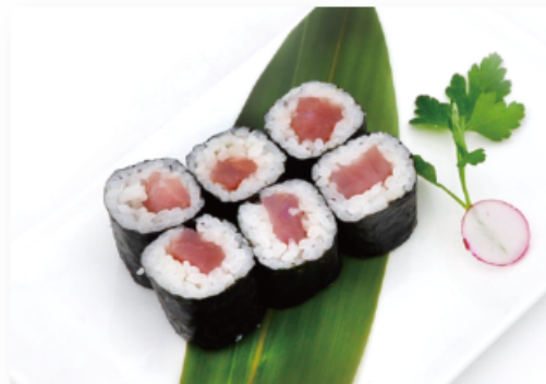
61. TEKKA MAKI tonno