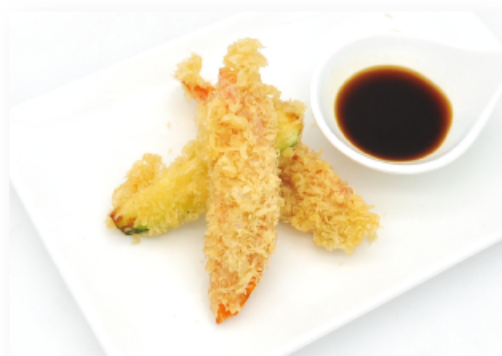
25. YASAI TEMPURA ● € 7,00 verdure