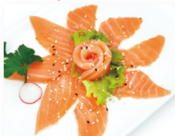
98. SALMONE € 7,00