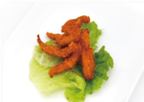
23. KARAAGE € 5,00 bocconcini di pollo