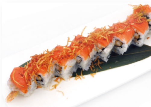
80. URAMAKI TIGER ● € 10,00 gamberi in tempura, salmone