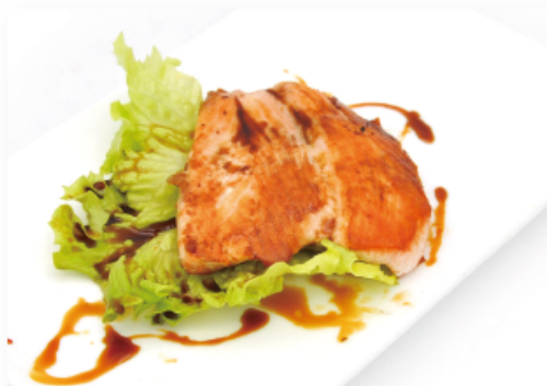
32. SALMONE € 8,00