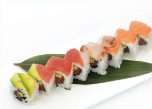
79. URAMAKI RAINBOW ● € 10,00 salmone, tonno, branzino, avocado