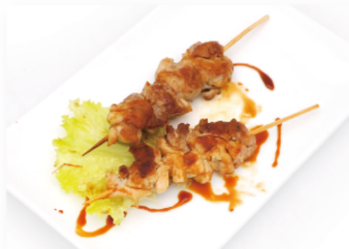
36. SPIEDINI DI POLLO € 6,00