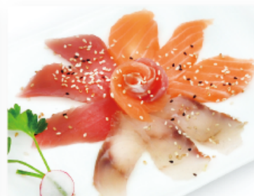
100. MIX € 8,00