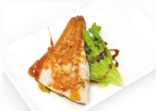
33. BRANZINO € 9,00