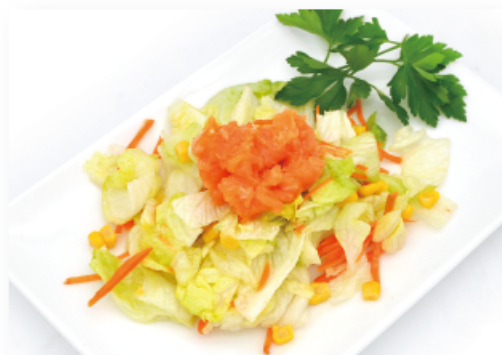
18. INSALATA CON SALMONE TARTARE € 6,00