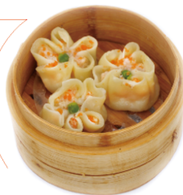
8. SIUMAI € 5,00 ravioli di gamberi e carne 3pz*