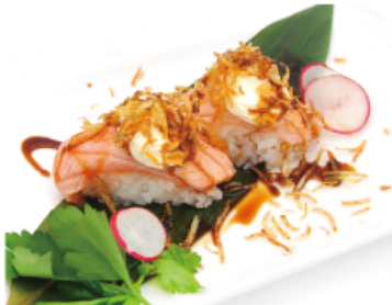
113A. SAKE FRESH € 4,00