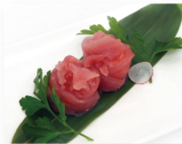
107. TUNA OUT € 4,00