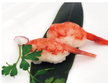
118. GAMBERI CRUDI € 3,00