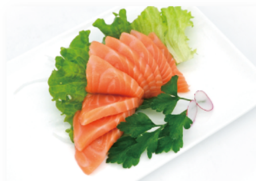
95. SALMONE € 10,00 filetti di salmone