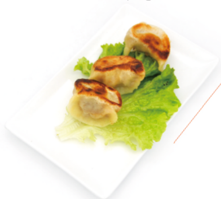
5. GYOZA € 4,00 ravioli di carne 3pz

Sono piccoli bocconi tipici della cucina antica meridionale, cucinati a vapore, fritti o stufati. In origine serviti rigorosamente accompagnati da thè non zuccherato