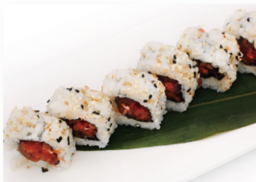
78. URAMAKI SPICY TUNA € 8,00 tonno tritato in salsa piccante