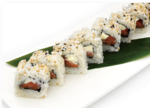
76. URAMAKI PHILADELPHIA € 7,00 salmone, philadelphia