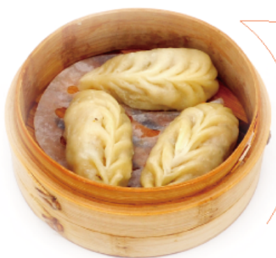
7. CAIJIAO € 4,00 ravioli di verdura 3pz