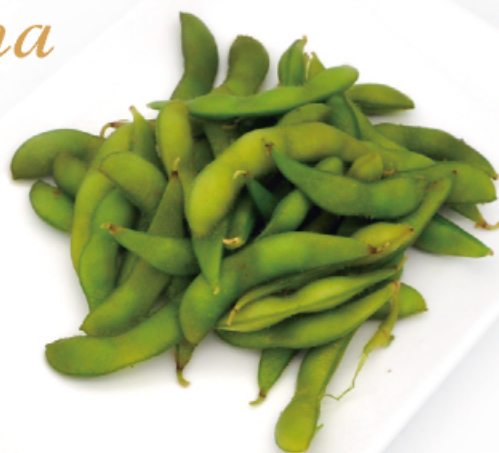
15. EDAMAME * € 3,00 fagioli di soia