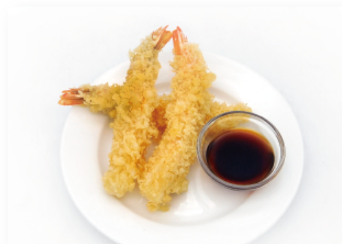
24. EBI TEMPURA * ● € 9,00 gamberi