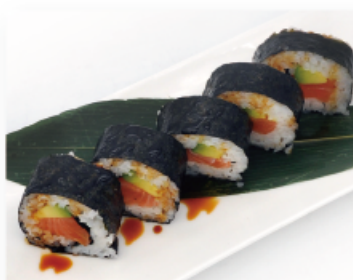
92. SALMONE € 7,00 salmone, avocado