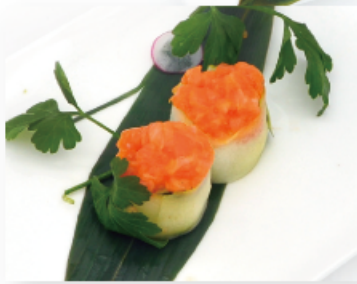
104A. SPICY GREEN € 4,00