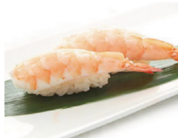
117. GAMBERI COTTI € 2,50