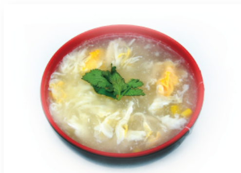
21. ZUPPA DI MAIS con pollo € 4,00