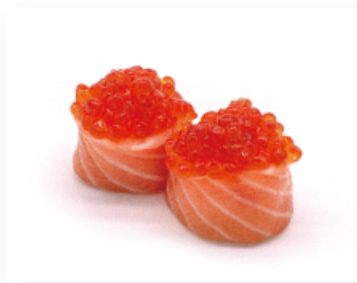
106B. IKURA € 5,00