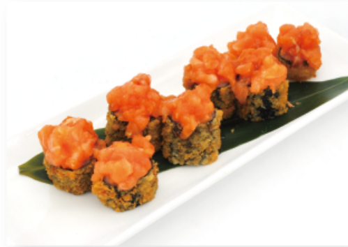
30B. HOSSO CRUNCHY SPICY € 8,00