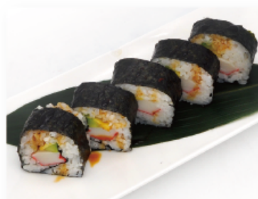
91. CALIFORNIA € 6,00 surimi di granchio, avocado