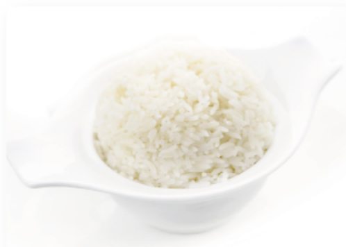
42A. RISO BIANCO € 2,00