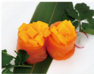
106A. MANGO € 5,00