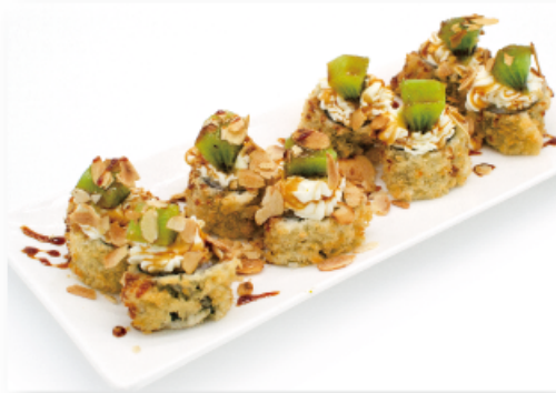
30A. HOSSO CRUNCHY GREEN € 8,00